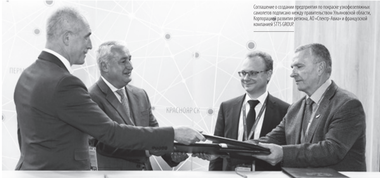
Соглашение о создании предприятия по покраске узкофюзеляжных самолетов подписано между правительством Ульяновской области, Корпорацией развития региона, АО «Спектр-Авиа» и французской компанией STTS GROUP.

Создание этого предприятия в регионе обеспечит сельхозтоваро-